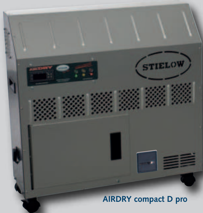
AIRDRY compact D pro