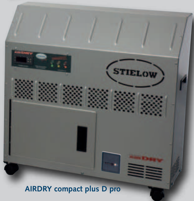
AIRDRY compact plus D pro