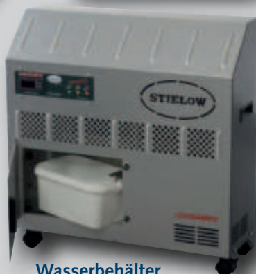
Wasserbehälter Option: Kondensatpumpe