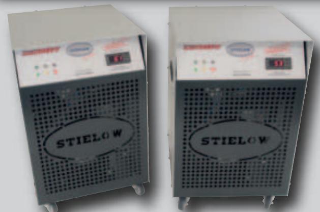
AIR DRY 6 D pro AIR DRY 6 plus D pro AIR DRY 5 D pro

– Wasserdirektablauf – Wasserbehälter Option: Kondensatpumpe